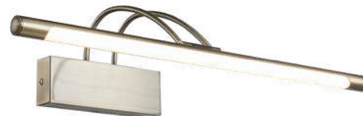
1 ■ MIRO04WL-L12B ■ MIRO04WL-L12BZ