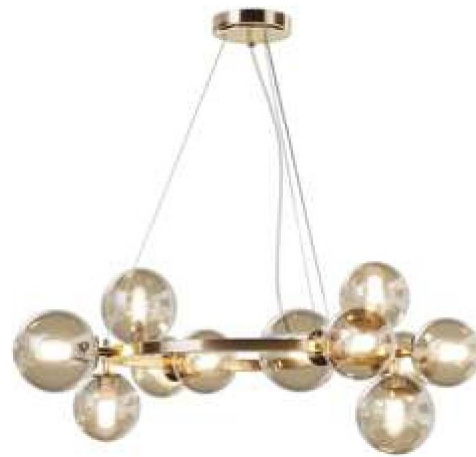
2 ■ ■ ■ ■ ■