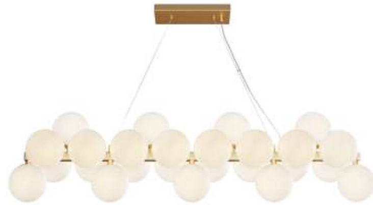
1 ■ ■ ■ ■ ■

FR Armature métallique en cinq couleurs : noir mat, noir, chrome, dorée, dorée mat, laiton. Globes en verre soufflé. Couleurs : fumé, ambre, cognac, blanc mat et noir. Design avec imitation d'une structure moléculaire. Hauteur des suspensions réglable par câble. Ampoule à culot G9.