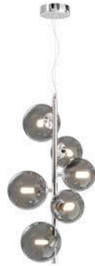
3 ■ ■ ■ ■ ■