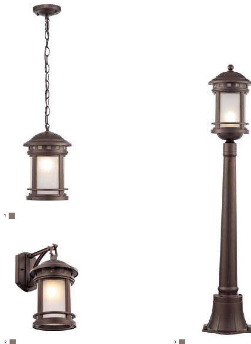
1 ■ O031PL-01BR

FR Corps en aluminium réalisé par technique de la ferronnerie d'art. Résistant à la corrosion et aux changements de températures. Revêtement par poudre de couleur marron. Source de lumière : ampoule à culot E27.