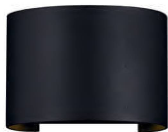
1 ■ □

FR Corps métallique, revêtement par poudre de couleur blanche et noire. Module LED. Résistance à la corrosion. Haut niveau de protection : IP54. Volets mobiles pour le réglage de l'angle du flux lumineux.